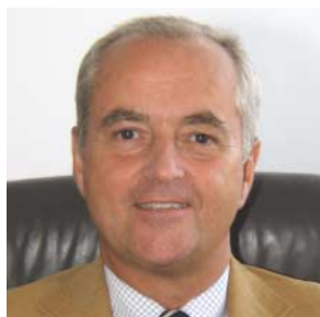
Dir. Werner Scherde

D ie Fertigstellung der umfangreichen Sanierung in Auwiesen steht nun unmittelbar bevor. Damit haben wir einen riesigen Schritt in Richtung Verbesserung der Wohn- und Lebensqualität gesetzt. Auwiesen mit ca. 3.000 Wohnungen ist für die GWG-Linz ein Stadtteil, der uns sehr am Herzen liegt. Mit der Einrichtung des GWG-Service-Point wollen wir