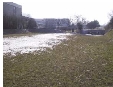
Vorher eine holprige Wiese, jetzt eine Besonderheit für alle Fußballfans, der neue Kunstrasenplatz.

Pasching besteht aus demselben Material. Vielleicht kommt der Bundesliga-Nachwuchs demnächst aus Auwiesen! Zum Schutz vor scharfen Bällen und