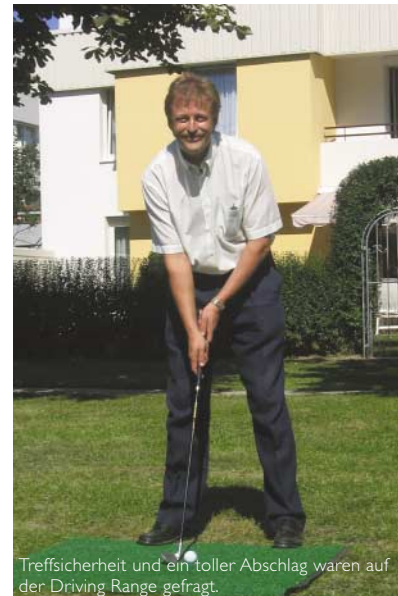
Treffsicherheit und ein toller Abschlag waren auf der Driving Range gefragt.