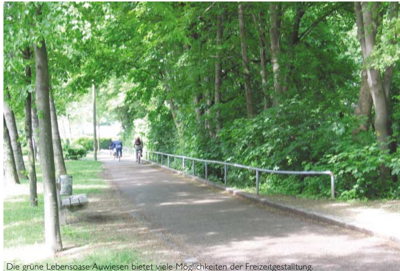
Die grüne Lebensoase Auwiesen bietet viele Möglichkeiten der Freizeitgestaltung.

Alles in allem präsentiert sich das heutige Auwiesen auf jeden Fall als Stadtteil, in dem das Leben wirklich lebenswert ist. Und das wissen auch seine Bewohner.