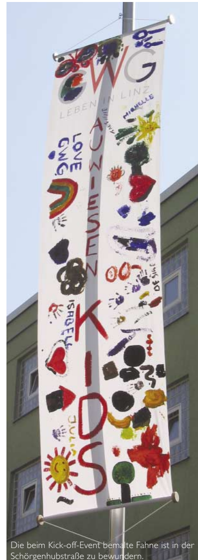
Die beim Kick-off-Event bemalte Fahne ist in der Schörgenhubstraße zu bewundern.

Auch die Spielplätze, die ständig gewartet und auf den neuesten Stand gebracht werden, bieten für große und kleine Kinder die ideale Möglichkeit zum Austoben.