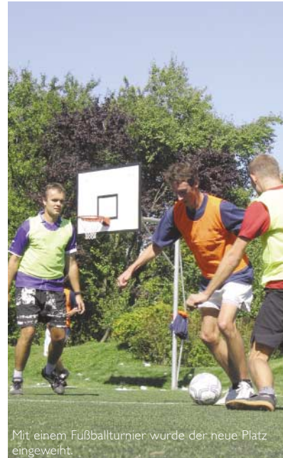
Mit einem Fußballturnier wurde der neue Platz eingeweiht.