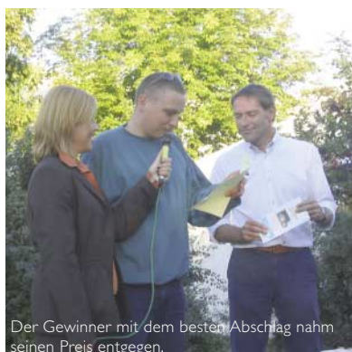
Der Gewinner mit dem besten Abschlag nahm seinen Preis entgegen.