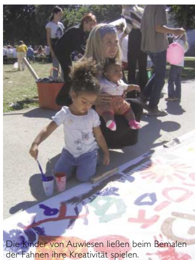
Die Kinder von Auwiesen ließen beim Bemalen der Fahnen ihre Kreativität spielen.