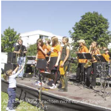
AM-DAM JAZZ brachten nicht nur die jungen Anwesener in Fahrt.