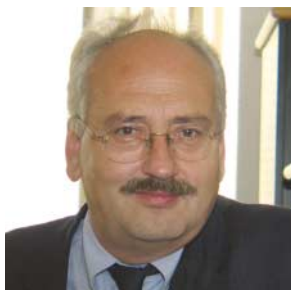
Dir. Hans-Jörg Huber